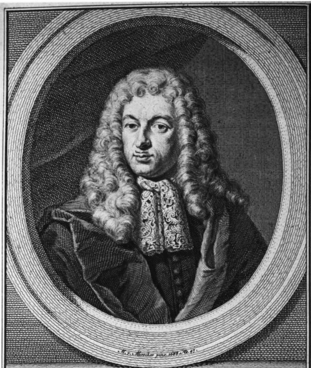
M R . NICOLAAS WITSEN, Burgermeester en Raad van Amsterdam, Extraordinaris Ambassadeur in Groot-Britanje enz.