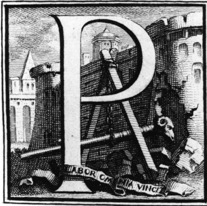
Versierd begin- kapitaal met storm- ram en Witsens wapenkreet 'Labor omnia vincit'. (In Jacobus Tollius' Epistolae itinerariae , 1700.)